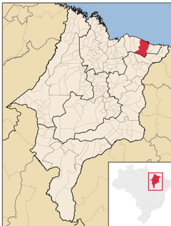
Figura 01 – Localização do Município de Barreirinhas em relação ao Estado do Maranhão

1.3.2. Barreirinhas se localiza a 257 km da Capital do Estado do Maranhão. O município é o detentor de patrimônio natural diferenciado em forma e extensão - o Parque Nacional dos Lençóis Maranhenses - com capacidade de atração de turistas nacionais e internacionais, sendo o principal polo turístico do Estado do Maranhão. Além disso, o destino faz parte da chamada “Rota das Emoções”, formada pelos Lençóis Maranhenses, Delta do Parnaíba e Jericoacoara.