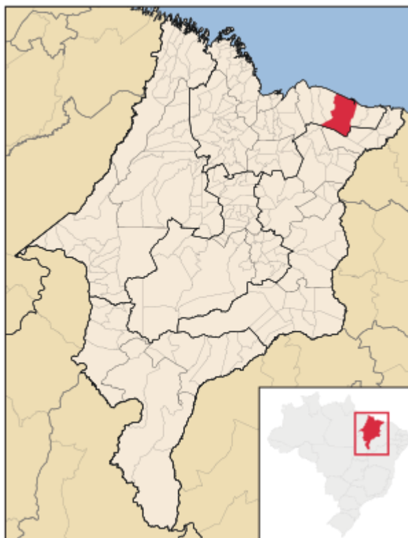
Figura 01 – Localização do Município de Barreirinhas em relação ao Estado do Maranhão

1.3.2. Barreirinhas se localiza a 257 km da Capital do Estado do Maranhão. O município é o detentor de patrimônio natural diferenciado em forma e extensão - o Parque Nacional dos Lençóis Maranhenses - com capacidade de atração de turistas nacionais e internacionais, sendo o principal polo turístico do Estado do Maranhão. Além disso, o destino faz parte da chamada “Rota das Emoções”, formada pelos Lençóis Maranhenses, Delta do Parnaíba e Jericoacoara.